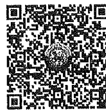
QR Code 2

ตรวจสอบจำนวนผู้ชำระค่าลงทะเบียนแต่ละรุ่น