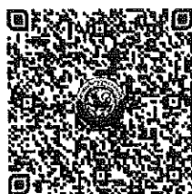
QR Code 1

ตรวจสอบจำนวนผู้ชำระค่าลงทะเบียนแต่ละรุ่น